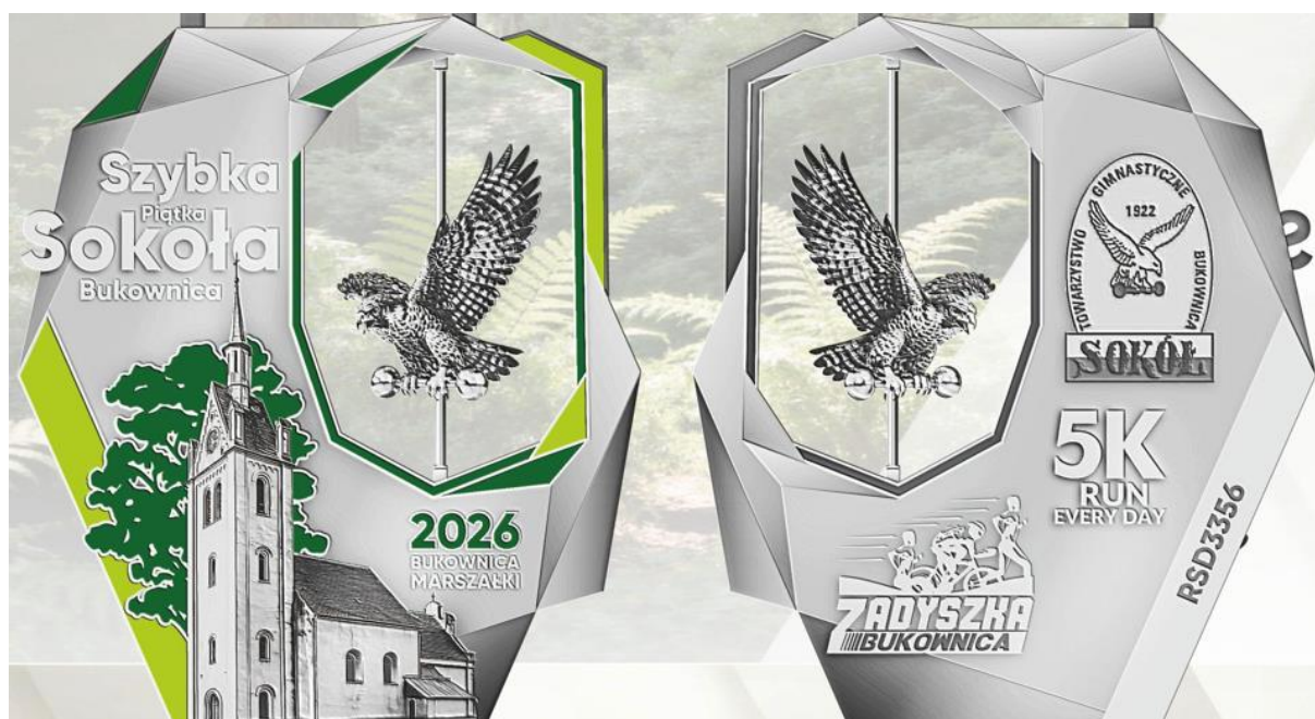
Medal z kręcącym się sokołem wokół własnej osi