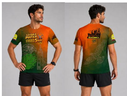
Koszulka Wilka szybkoschnąca

Pamiątkowa koszulka Szybka Piątka Sokoła w cenie 79 PLN (zamówienia przy zapisach)